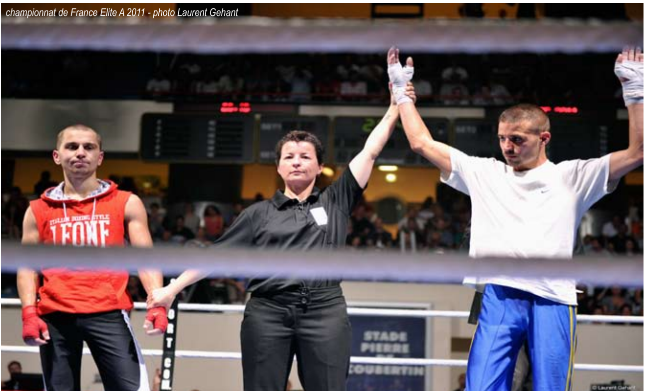
championnat de France Elite A 2011

- Après l'étude de ce dossier, la commission nationale en réunion plénière attribuera ou non le titre pour lequel il postulait.