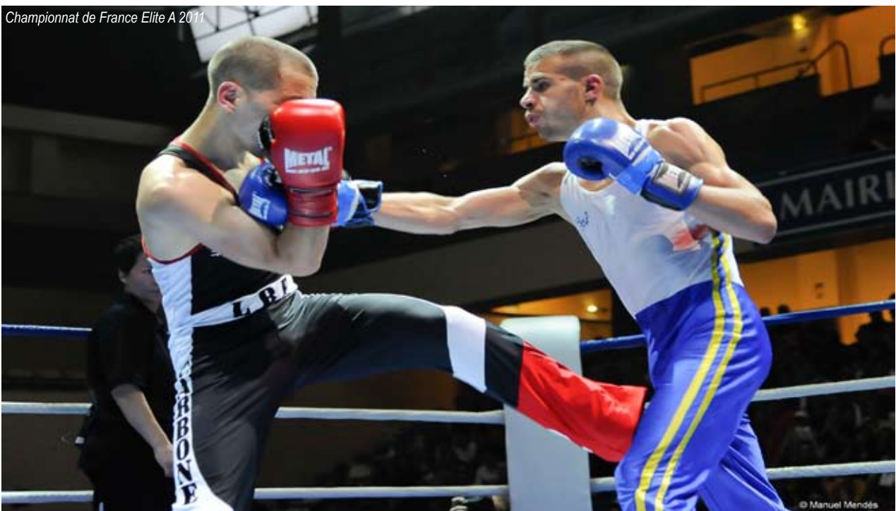
Championnat de France Elite A 2011

Pour une demande de Validation des Acquis de l'Expérience concernant le CQP AS, veuillez contacter la FFSBF&DA.