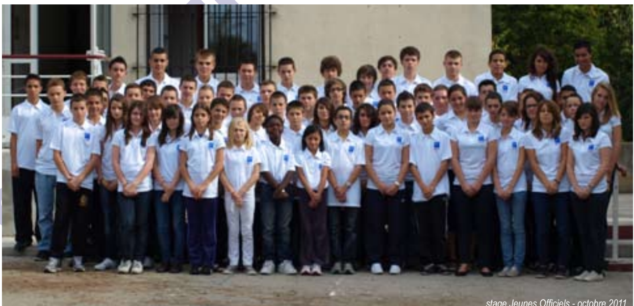
stage Jeunes Officiels - octobre 2011

Comme tous règlements fédéraux, ces textes sont appelés à évoluer. Toutes modifications apportées par le Comité Directeur Fédéral entraîneront la révision de ce texte d'origine.